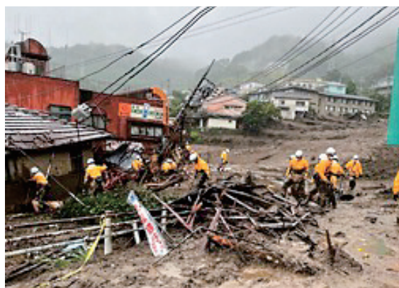
静岡県熱海市土石流災害活動状況